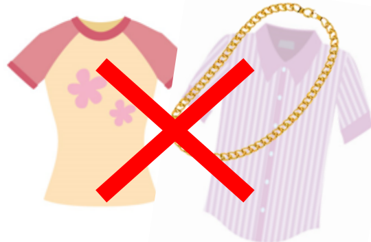
プリント、ボタン、刺繍など