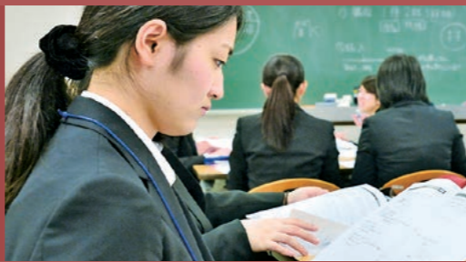
教員免許状取得および教員採用試験合格に向けた支援内容（一部抜粋）