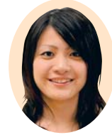
文学部言語表現学科