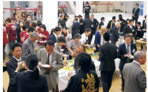
和気あいあいの歓談で盛り上がった「コミッティー八事」