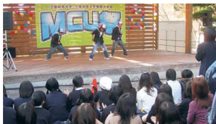
熱気にあふれた「MCU祭2009」

短期大学部KCD C（キッズ・カルチャー・デザイン・センター）や松阪子どもNPOセンターなど共催の「いっしょに遊ぼう子育てフェスタ」が十月十七日、キャンパスで開催され、参加団体と訪れた三千六百人の親子連れらが交流を深めた。