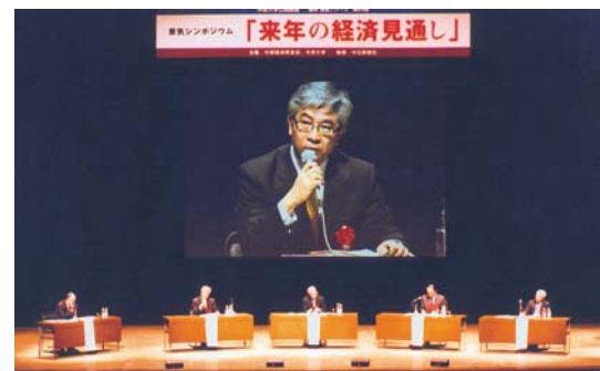
1,270人の聴講者を集めて開かれた景気シンポジウム

昨年のリーマン・ショックにより米国バブルが崩壊し、世界経済はいろいろな意味でバランスシートが崩れた。今はその回復過程と言えるが、先進国が調整に明け暮れる中、中国やインドなどの新興国が世界経済を牽引していく構図はますます強まってくる。国内の景気は多少回復したとはいえ、実感はない。復活のポイントとしては、