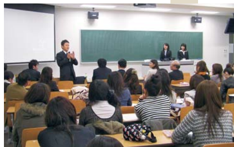
卒業生から仕事の厳しさを学ぶ学生たち

が十一月二十六日、「働くことの厳しさと魅力」をテーマに「合同キャリア交流会」を名古屋キャンパスで開いた。同学部、学科の学生らが参加し、第一線で活躍している卒業生と内定を得た四年生からアドバイスをもらった。