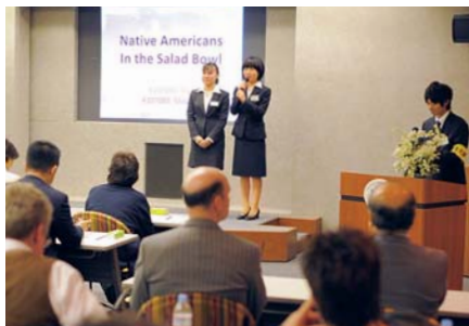
企業の人を前に英語で研究発表をする学生たち

抱える人種問題の歴史と現状)のテーマで発表した。懇談会も行い、企業の人から「真剣に取り組む姿が好印象」などの感想が述べられた。 国際英語学科は英語をツールとする発信型の学習と学生の主体的な行動を重視している。その成果を披露