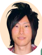
アイシン・エイ・ダブリュ