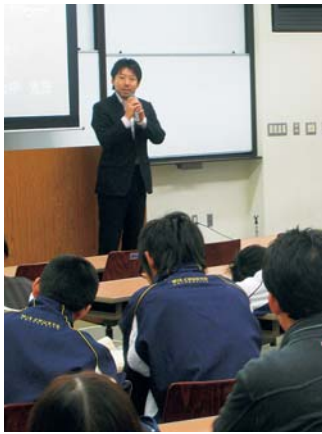
演習Iの特別講師として講演する山中市長

現代法経学部は十一月十一日、生きた政治、行政を学ぶ、学問へのモチベーションを高めようと、一年生の「演習I」の講師に山中