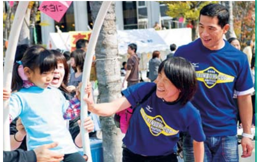
④ 大学祭を楽しむ参加者たち(豊田キャンパス) ⑤ 受付でイベントなどの説明を聞く参加者たち(名古屋キャンパス)