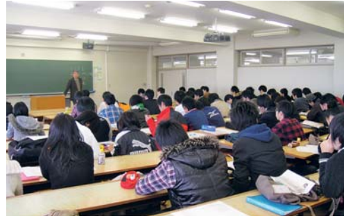
キャリア・エンジニアリングの講義を聴く学生たち