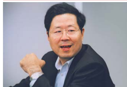
米国ハーバード大学ケネディ行政学大学院公共政策学科(修士課程)修了。博士(商学)。大和銀行等を経て本学教員に。総合政策学部教授を兼任。50歳。

元々、ある都市銀行(今では名前も変わっている)に勤務していましたが、一九九〇年代のバブル崩壊と不良債権問題の深刻化のなか、正直言って、「業況悪化する一方の銀行と命運を共にするより、他道を探れないか」という気持ちを持つようになりました。そんな中、米国の経済誌 Business Week の「It's a Wonderful Bank」と題した記事(一九九五年十一月二