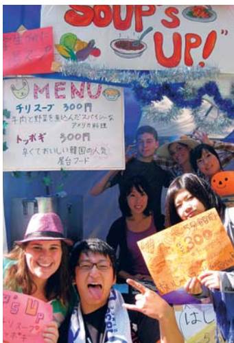
売れ行き好調で大喜びの交換留学生たち

外国人留学生と日本人学生との交流を目的に、国際センターが大学祭への共同参加者を募り、集まった交換留学生十一人と本学の学生三十四人の計四十五人が協力して模擬店を出店した。留学生たちは日本人の一年間本学に交換留学して