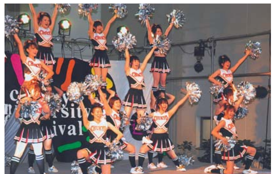
練習成果を存分に発揮 華麗で見事なバランス