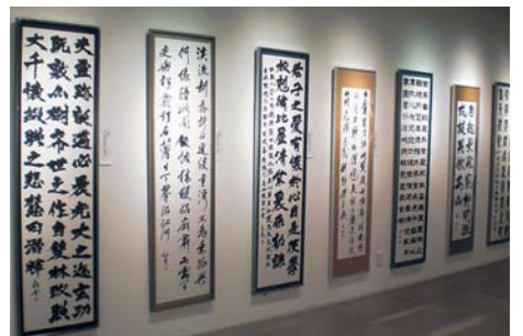
一般の人も多く来場した書道部の「秀抜展」