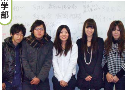
受賞した宮内プロジェクトの学生5人