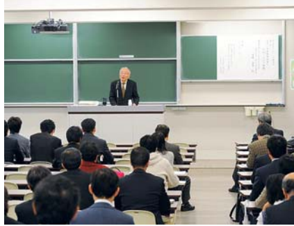
12月5日に行われた講演会「大学教育改善とFD/SDの課題」

〇八年四月に文部科学省の省令である大学設置基準の一部改正され、「大学は、授業の内容および方法の改善を図るための組織的な研修および研究を実施するもの」と規定さ