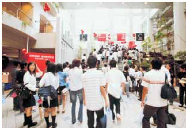
高校生や保護者で賑わう受付会場のガレリア (名古屋キャンパス・センタービル)