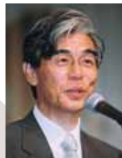
御手洗康・ 放送大学学園理事長