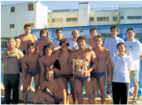
結成2年目でインカレに出場した水球同好会のメンバーら

昨年発足したばかりの水球同好会が、今夏の中部地区予選で優勝、九月に東京で行われたインカレに出場し、強豪の早稲田大と対戦した。結果は0-28だったが、メンバーらは「来年は初戦突破を」