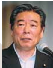
鈴木政二・ 内閣官房副長官(当時)