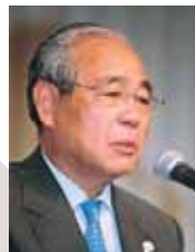
松原武久・ 名古屋市長