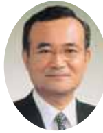
野呂 昭彦 三重県知事

三重中京大学・短期大学 2007」が、十月二十七 部合同の大学祭「MCU祭 日と二十八日の二日間、行