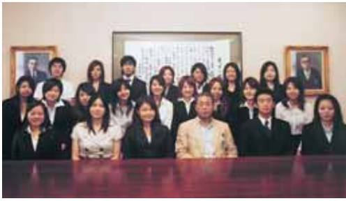
表彰された学生たちと北川学長