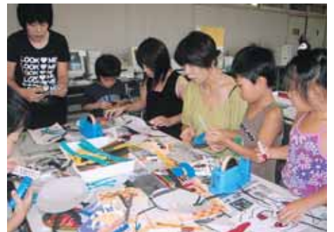
紙細工に挑戦する親子連れ

三重中京大学短期大学部 と松阪子どもNPOセンタ ー共催の「いっしょに遊ぼ う子育てフェスタin松阪」 が九月八日、キャンパスで 開かれた。厳しい残暑の中、 約四千人の親子がコンサー トやフリーマーケット、ゲ ームなどを楽しんだ。 職場や地域の子育て支援 団体の交流を深め、サポー トの輪を広げていくことを