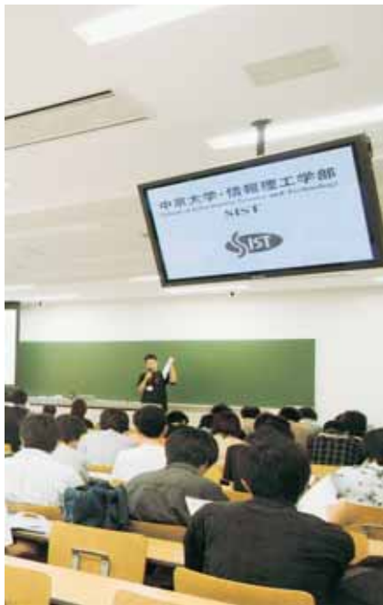
学部の特徴や授業内容を熱心に聞く高校生ら(豊田キャンパス)