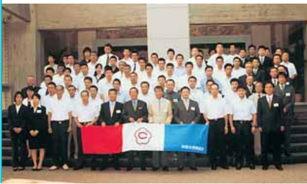
APC会に出席した部会員ら