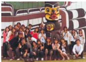
海外ビジネス研修に参加した学生たち

国際センターは、夏期休暇を利用した海外語学研修(七月三十一日―八月二十四日、カナダ)と、海外ビジネス研修(八月二十五日―九月八日、オーストラリア)