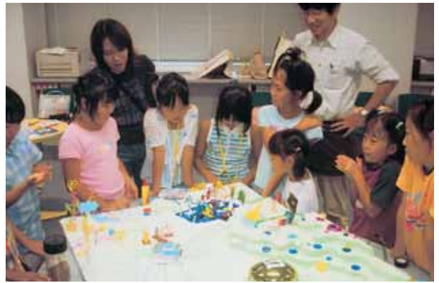
日本学術振興会主催