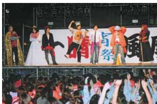
〈昨年の大学祭から〉