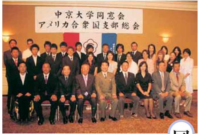
同窓会アメリカ支部設立に尽力した同窓生ら