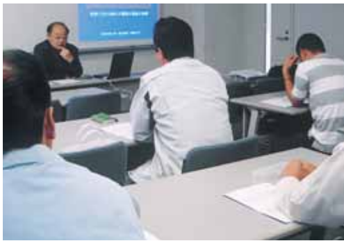
三重中京大学で行われている研修