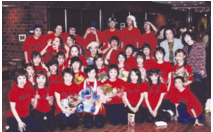
豊田市民文化会館で創作舞踊を発表した舞踊部とHIPHOPダンス、先輩、有志の皆さん