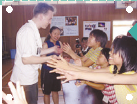
多くの小学生が参加し、英語に親しんだ「ふれあい英語教室」