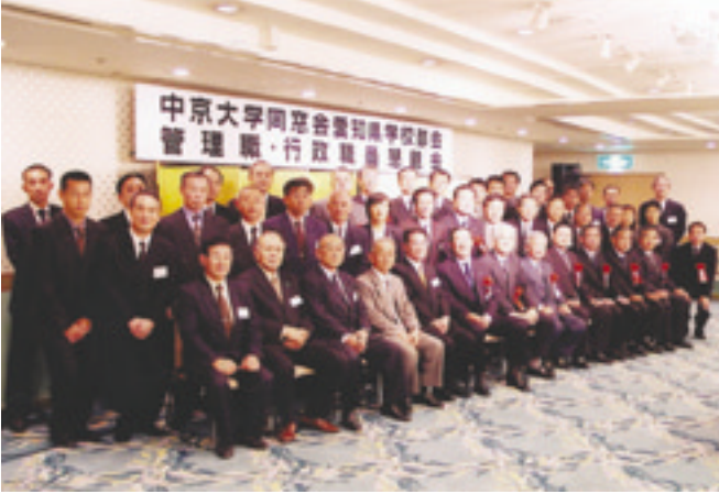
「後輩のためにも頑張ろう」と集まった愛知県 学校部会管理職・行政職の同窓生たち