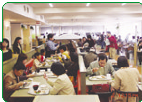
①続々と詰めかけ、受付に並ぶ同窓生と家族ら ②センタービルの学生食堂で食事する父母ら(ともに名古屋キャンパスで)