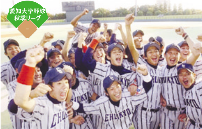
愛知大学野球秋季リーグの優勝を決め、歓喜の声をあげる硬式野球部ナイン(10月19日、名古屋・瑞穂球場)

ロースクールの教育の拠点となるのは、名古屋キャンパスに建設中の八階建て「Cアネックス」ビル。弁護士・裁判官・検察官を経験した教員がモニター室からリアルタイムで学生を指導する模擬法廷