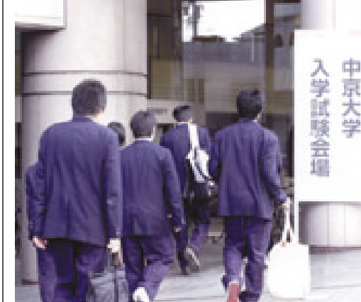
試験会場に入る受験生たち (11月22日、センタービル入口で)

二〇〇四年四月に新入生を迎える本学の入学試験が、十一月十六日(特I・特II・特IIIなど)、同二十二・二十三日(一般推薦など)の推薦入試で始まった。 志願者は推薦入試全体で三三四四人。前年より一七〇人、五・四%増加した。入試センターでは、一般推薦などの地方試験会場を二会場(岐阜市、浜松市)増設したことや、六つの学部が一般推薦を二日間で実施したことなども、志願者増の一因と分析している。 来月四月に新設する生命システム工学部の一般推薦は、試験科目が小論文の論述型、基礎学力テストを行う基礎学力考査型の二通りの選考方法で実施。志願者は九四人、志願倍率は一・六倍となった。(特II推薦を含む) 本学の今後の入試日程は、二月一、四、七日に一般入試(前期日程)、三月七日に一般入試(後期日程)を実施する予定。他に、個別試験を課さない大学入試センター試験