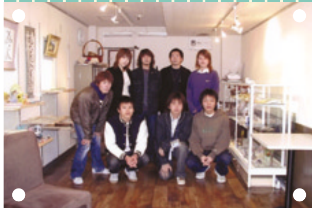
「八事の活性化に」役と張り切る学生たち (「まちのえん工房」店内で)