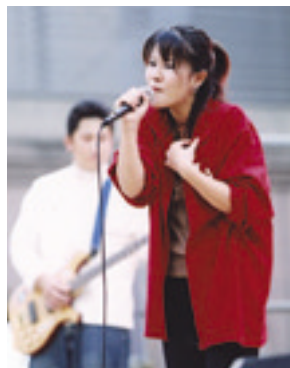
ここは私の出番でした