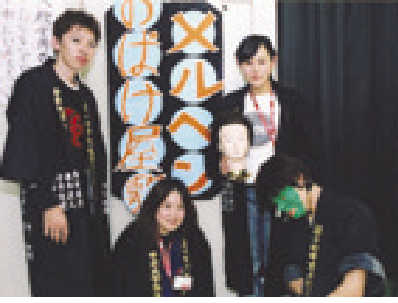
怖くて可愛いお化けでした

「いつもかわいいあのキャラクターたちがお化けになると・・・」というコンセプトのメルヘンお化け屋敷。タイトルにした「メルヘン」という言葉に悩まされたけど、みんなで考えた結果、今回のような「怖いながらもキャラクター本来の可愛さは残す」という独特なお