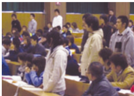
150人が参加、活発に論議した交流会