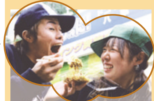
「いやあ、ごちそうさま」「どうぞ」