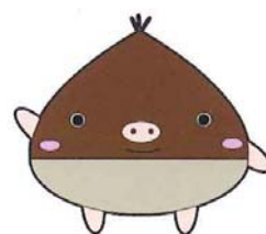
図書館キャラクター「くりぶー」

●利用登録時の個人情報は「学校法人梅村学園個人情報保護の基本方針」に従い、取り扱われ、業務上必要以外の目的では使用いたしません。