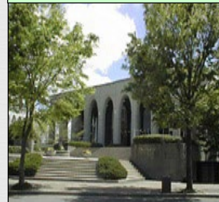
豊田キャンパス 10号館