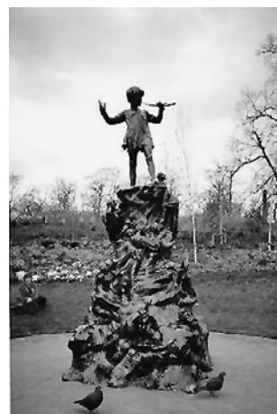
ピーター・パン像