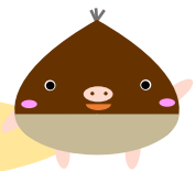
図書館広報隊長 くりぶー