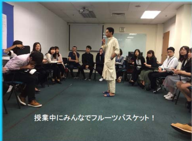
授業中にみんなでフルーツバスケット！