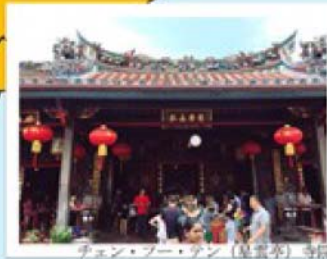
チェン・ブー・アン（陳雲秀）寺院

洞窟内にヒンドゥー寺院がある。 272段の階段を登ると神々しい 光景が広がっている。