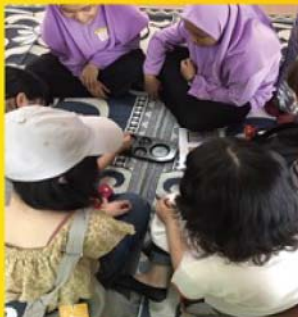
マレーシアの伝統的な遊びキョンカを楽しみました (ビー玉を使ったボードゲーム)