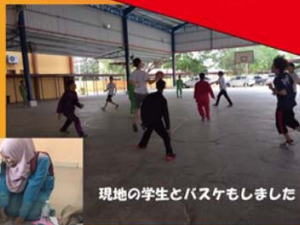
現地の学生とバスケもしました