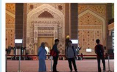
奥にはお祈りしているムスリム