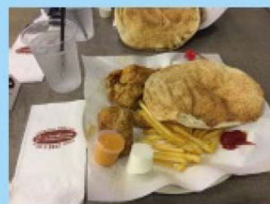
フライドチキンとチャパティー