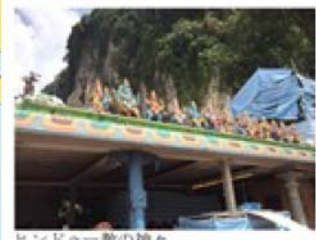
ヒンドゥー教の神々