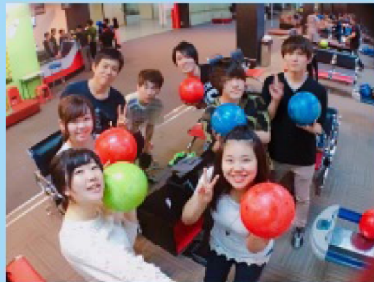
みんなでボウリング！