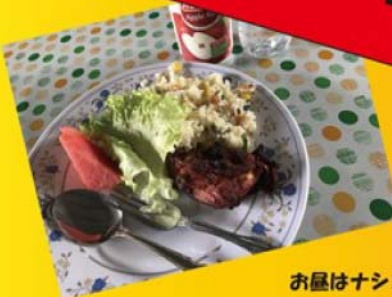
お昼はナシゴレン〜♪