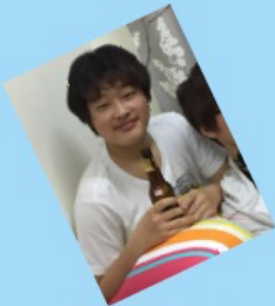
ジュースおいし～ マレーシア最高！

研修終わりには、みんなで近くのショッピングモールや街へ 出かけ、それぞれ好きなことをして楽しみました。