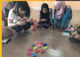
お礼に折り紙を現地の学生に教えました