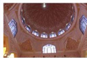
モスクの天井のドーム