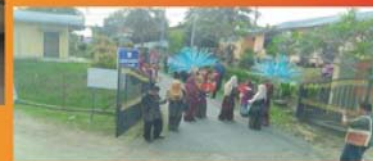
盛大にお出迎えしてくれました