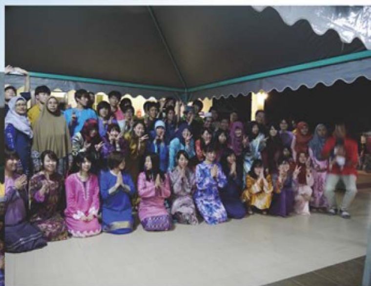
テメローでのファームステイ、さよならパーティーでの記念撮影 民族衣装をまとっての異文化交流・異文化体験