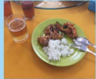
中華料理が多かった