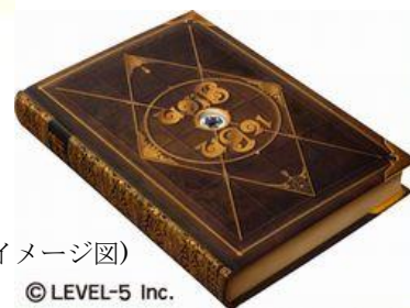
(冒険の書 イメージ図)