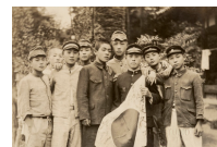
The Last Kamikaze: Testimonials from WWII Suicide Pilots