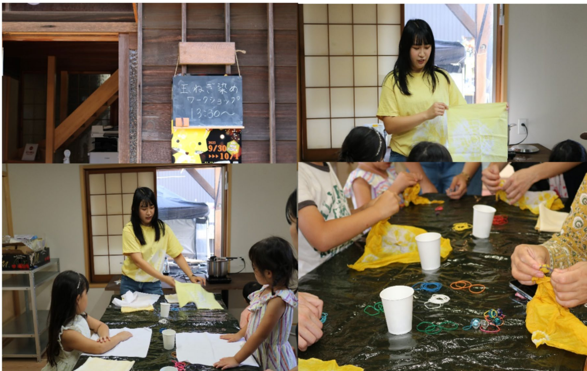
常滑市大野町で行われたイベントの様子