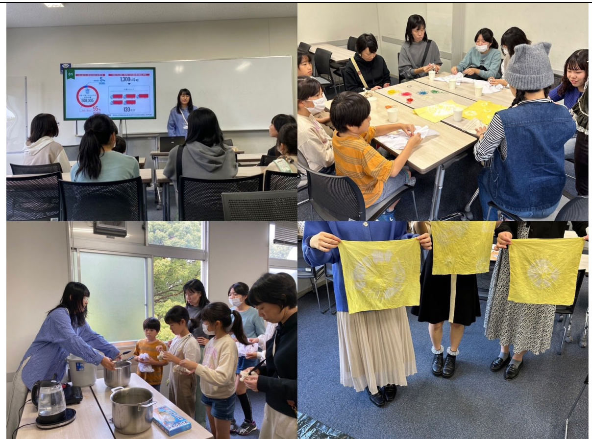
大学祭でのワークショップの様子