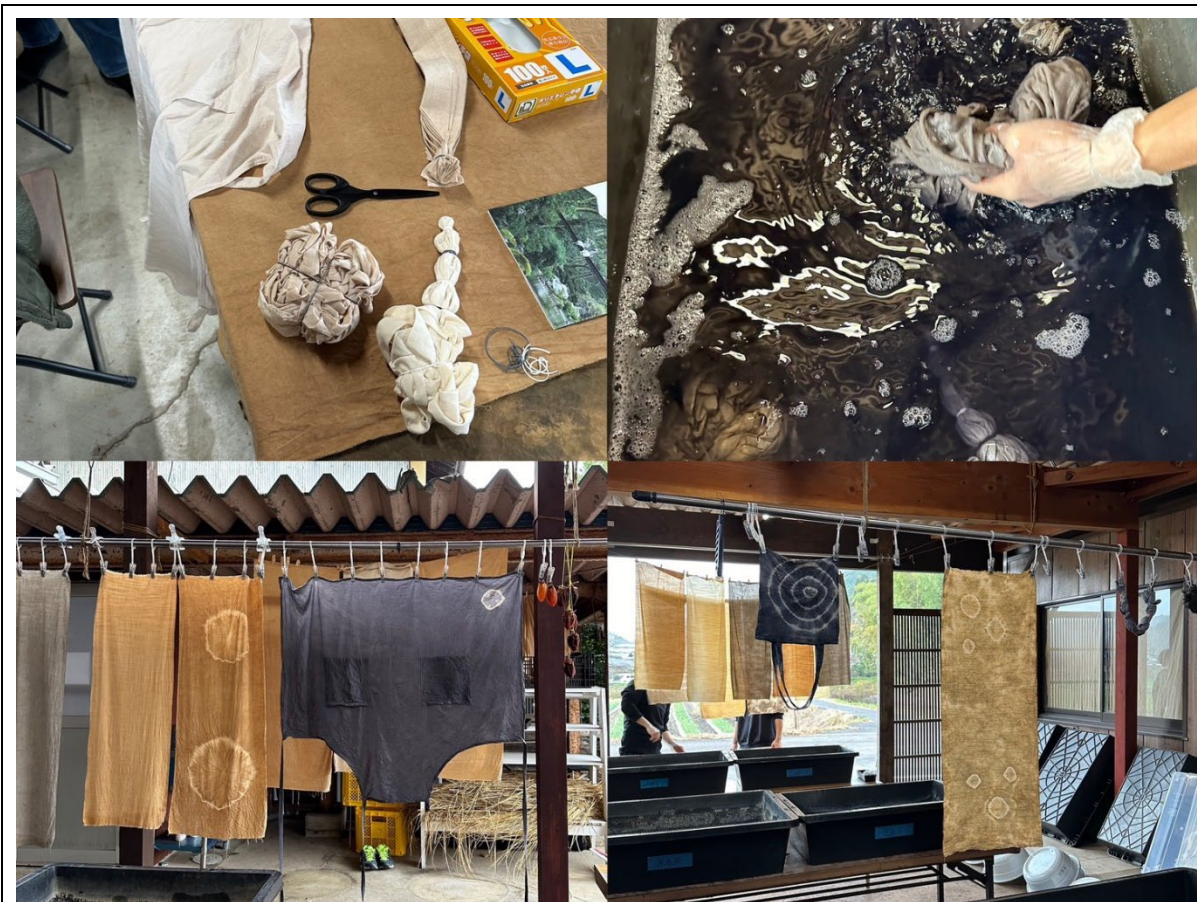
岐阜県山県市での柿渋染め体験の様子