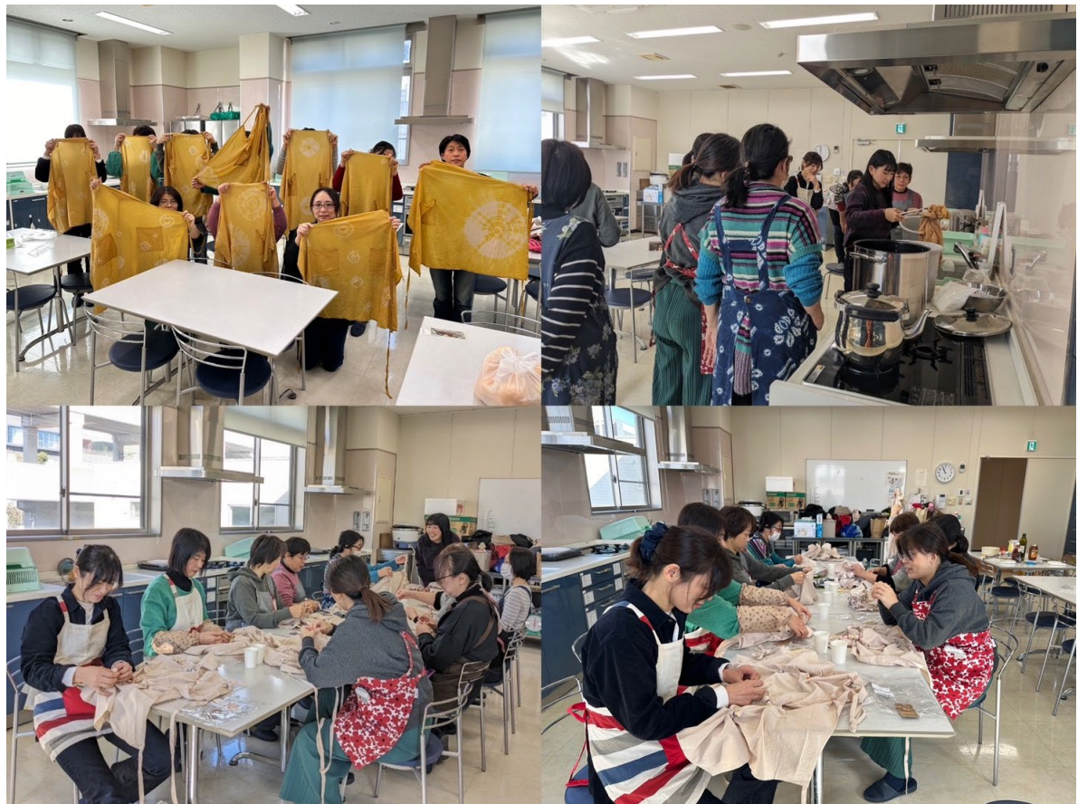
東海市の農業協同組合で行われたワークショップの様子