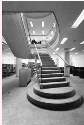
▲1階から2階への階段

運搬作業の後は、新館での配架が待っていた。一人ひとり担当部分を決め、段ボールから出しては配架を繰り返した。腕が上がりなくなり、体は痛くなり、1冊の本がとても重く感じるようになった。が、皆の努力で3月末には、概ね資料が段ボールから出され、書庫や開架室は空になった段ボールが山のように積み上げられていた。この間の作業は、豊田分館職員だけではなく、名古屋校舎の図書館本館からも職員が日替わりで応援に駆け付けた。短い間に10万冊にもおよぶ資料の移動ができたのは、その協力があつたからこそである。