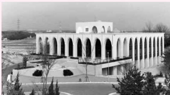
▲完成した豊田図書館

カウンター前には2階への広い螺旋階段。それを上がるとガラス窓で囲まれ、図書館の外の風景も見渡すことのできる2階閲覧室が広がる。さらに閲覧室の奥には静粛学習室と一般閲覧室。表側にはグループで学習のできるグループ学習室が2部屋、さらに、ガラスとドアで仕切られた2階ラウンジがある。ここは、1階エントランスホールと吹き抜けで空間を共有する素晴らしい空間となっている。カウンターの奥は、事務室スペースとなっていて、事務室、厨房、トイレ、応接室（館長室）、会議室、資料室、司書講師研究室が備わっている。カウンターの後ろには書庫に繋がる階段がある。事務室からは、エレベーターで書庫に降りるのだが、ここにも当時の基本設計要領通り、職員の要望に応えた配慮が見てとれる。図書整理を終えて書庫に配架に行く場合には、事務室から直接エレベーターに乗って各書庫に行くことができるようにエレベーターの位置を決定した。このことは業務効率のアップと疲労軽減に役立っている。