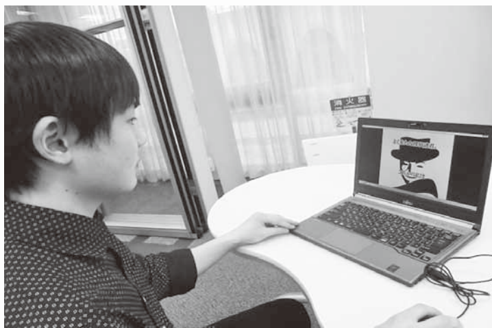
▲参加した学生が貸出用ノートパソコンで「犯行予告」を確認

参加者は探偵と図書館に調査に赴き、トランプの謎を解き明かして、盗まれた物とトランプが変装した犯人を捜す。