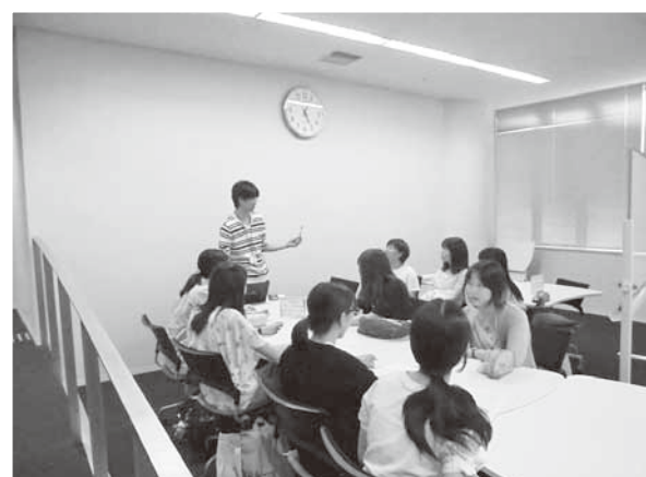
ラーニング・アドバイザーによるレポートの書き方講習会