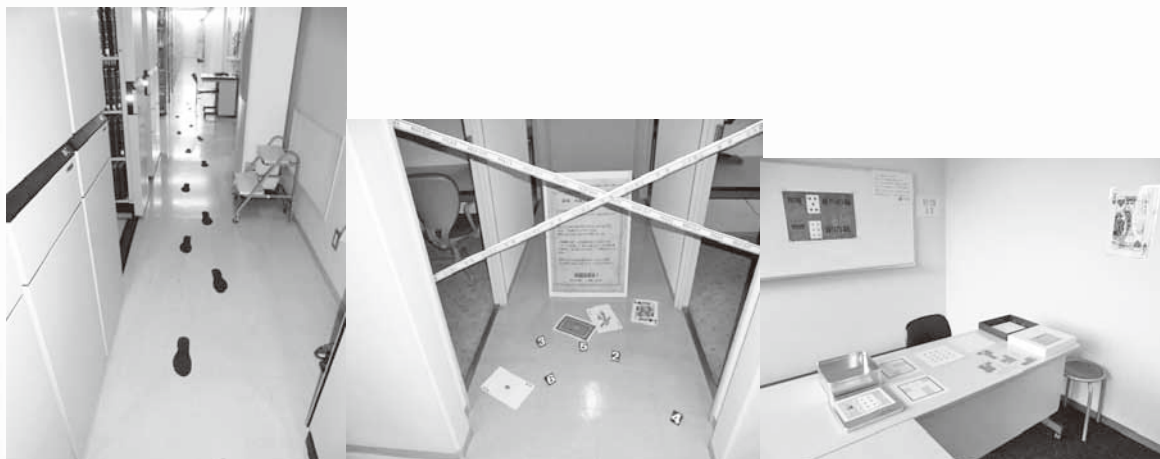
▲イベント用に設定された犯行現場や謎解き部屋 等

今後は、このようなイベントに改善を加えながら定期的の実施していきたい。これにより、普段は書庫利用や OPAC 検索をしない学生達に、少しでも興味を喚起してもらうことで、図書館の有効利用を促進していきたい。