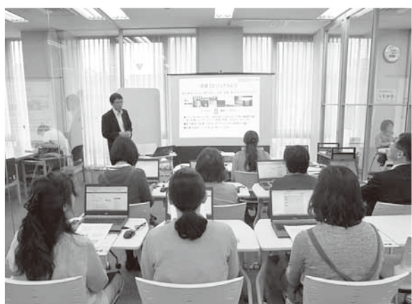
新聞記事などのデータベースを検索する方法を学ぶ受講者たち

一覧画面が表示される。キーワードがいつ頃から使われているかを知りたい場合は、「順序」を古い順に切り替えて検索する。検索した結果、ヒットした件数が多すぎて、記事を探すのが大変な時は、検索条件を追加し、さらに記事を絞ると、記事を見つけやすくなる。再生可能エネルギーで、愛知県の行政や企業に関連した記事を見つけたい時は、「再生可能エネルギー」「愛知県」とキーワードを重ねて、絞り込めばよい。受講者たちは「今後、レポートを書く時などに、新聞記事のデータベースを大いに活用していきたい」と話していた。